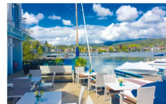
Das Marina Café lädt zum Träumen und Genießen ein ...